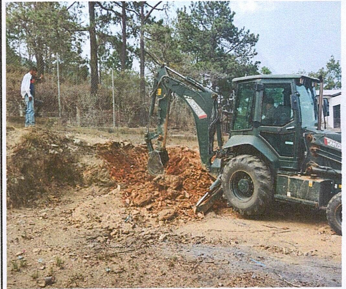
Foto 2: Aquí se inician los trabajos para que el piso rocoso quede plano.