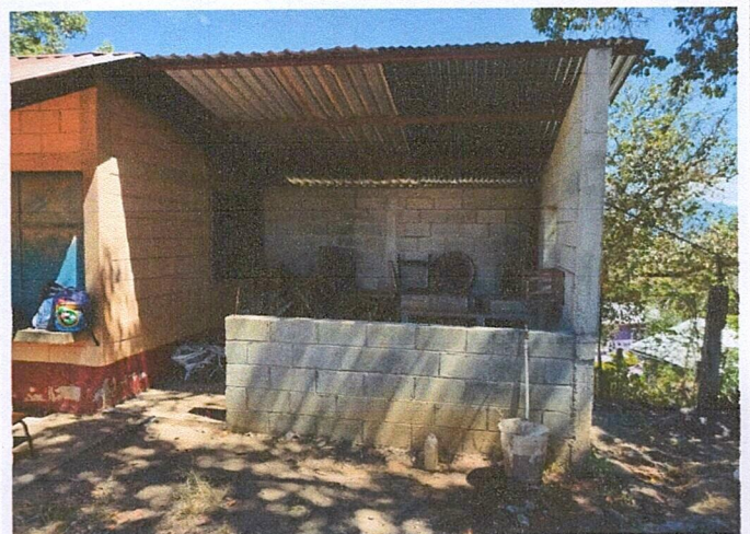
Foto 4: Cocina en condiciones inapropiadas para preparar los alimentos, se necesitan tinacos y mejoramiento de instalación de agua potable.

Observación: Si es necesario se pueden agregar hojas adicionales y agregar el número de hojas.